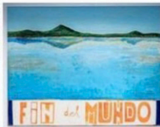
'Fin del Mundo', door Ronald Ruseler.