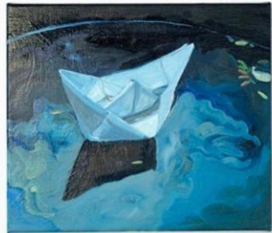
Boetje II, door Alice Brasser.