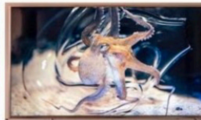
Spectaculaire video van een octopus, door Tuomas A. Laitinen.