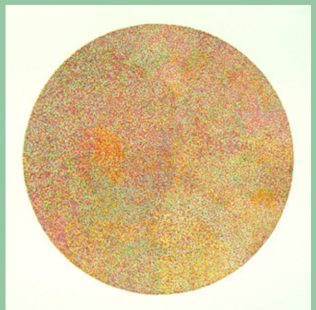
Ian de Ruiter - Odoodem Animus